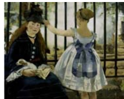
Edouard Manet Le chemin de fer

Paris zur Zeit des Impressionismus. Die Künstler, die zwischen 1865 und 1895 in der französischen Hauptstadt lebten und arbeiteten, zeigen eine Großstadt in rasanter Verwandlung: neue Boulevards und Plätze, Bahnhöfe und Metro, die Gare Saint Lazare und das Europa-Viertel, Sacré-Coeur auf dem Montmartre und der Eiffelturm an der Seine oder die wachsenden Industrieanlagen am Rande der Stadt. Zum ersten Mal wird die Großstadt zu einem zentralen Thema der Kunst. Die Impressionisten und ihre Zeitgenossen entwickeln mit neuen Bildtechniken das Portrait einer modernen Stadtgesellschaft, ihrer Arbeit und Vergnügungen, das Bild des modernen Großstadtlebens.